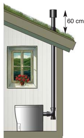
Ventilasjonsrøret føres rett opp og over taket.