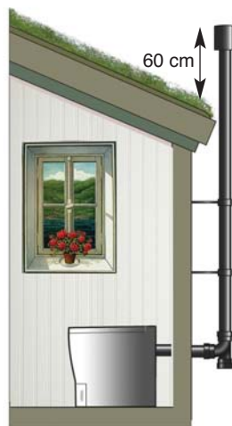
Ventilasjonsrøret føres ut gjennom vegg og opp over taket.

Det må være en jordet stikkontakt i forbindelse med toalettet, normalt trenger du ikke å endre eksisterende installasjon, da toalettet kun bruker et gjennomsnitt under forbrenning på 850W/time.